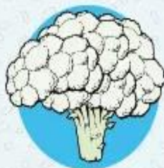
Цветная капуста ≈ 95% воды