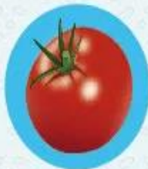
Помидоры ≈ 95% воды