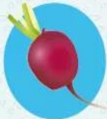
Редис ≈ 95% воды