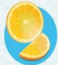
Цитрусовые ≈ 92% воды