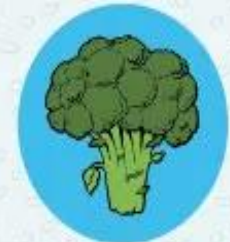
Брокколи ≈ 91% воды