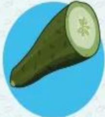
Огурцы ≈ 96% воды