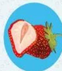
Клубника ≈ 92% воды