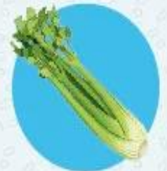
Сельдерей ≈ 91% воды