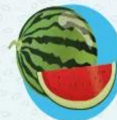
Арбузы ≈ 92% воды