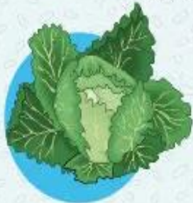
Капуста ≈ 96% воды